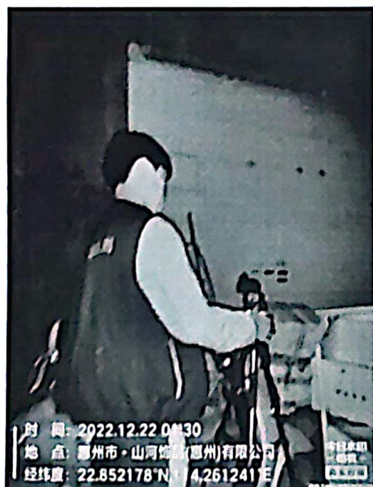
图 7: 厂界西北侧外 1m 处 3#