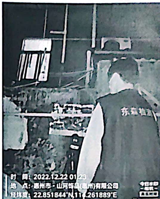
图 6: 厂界西南侧外 1m 处 2#