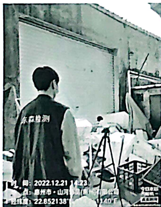
图 3: 厂界西北侧外 1m 处 3#