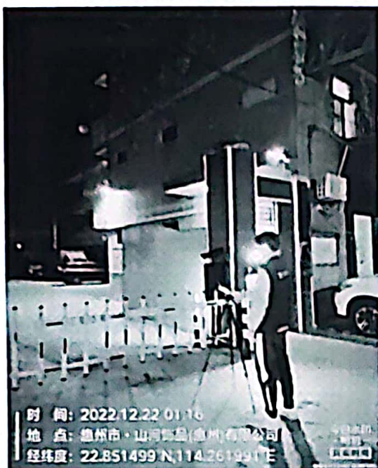
图 5: 厂界东南侧外 1m 处 1#