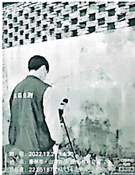
图 4: 厂界东北侧外 1m 处 4#