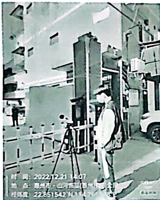
图 1: 厂界东南侧外 1m 处 1#