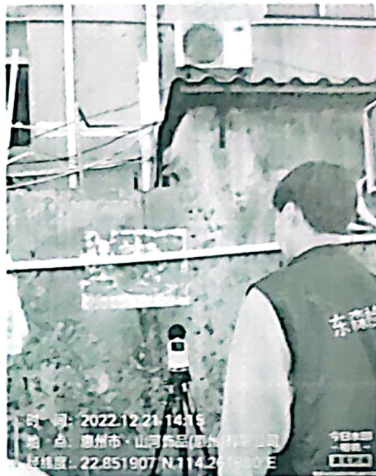
图 2: 厂界西南侧外 1m 处 2#