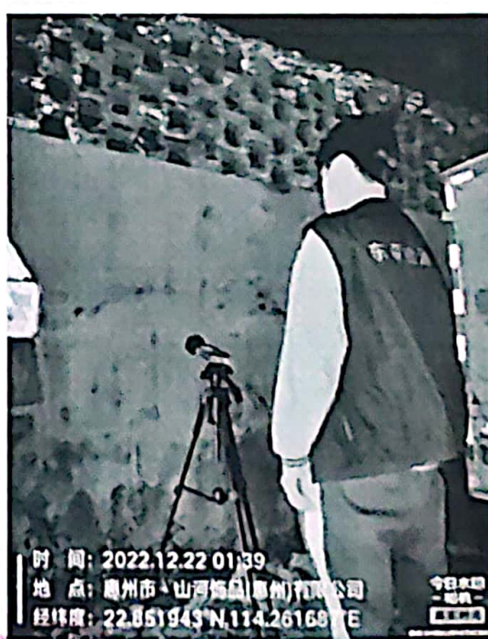
图 8: 厂界东北侧外 1m 处 4#