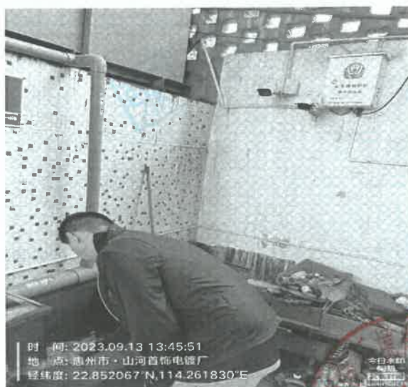
图 1: 废水排放口