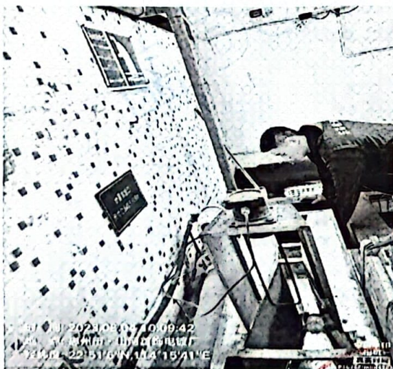
图 1: 废水排放口